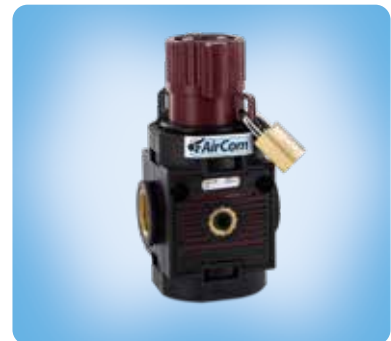
V0 manuelles Einschaltventil

Wahlweise Ausführung, es ist der entsprechende Buchstabe hinzuzufügen 24 V AC, 2 W Anschlussspannung für S0 S0...0.X 115 V AC, 1 W Anschlussspannung für S0 S0...0.Y 230 V AC, 1 W Anschlussspannung für S0 S0...0.Z pneum. Ansteuerung C402600014, statt elektrischer Betätigung für S0 S0...0.P